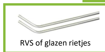
RVS of glazen rietjes