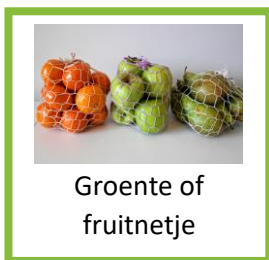
Groente of fruitnetje