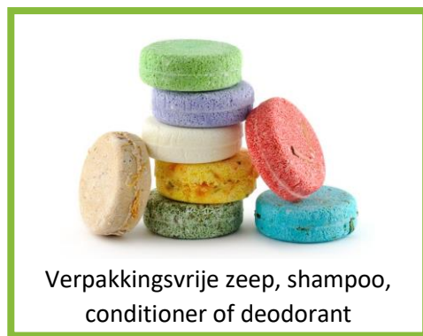
Verpakkingsvrije zeep, shampoo, conditioner of deodorant