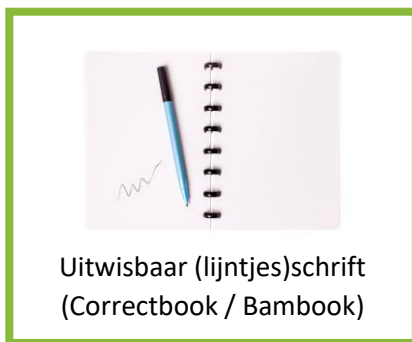
Uitwisbaar (lijntjes)schrift (Correctbook / Bambook)