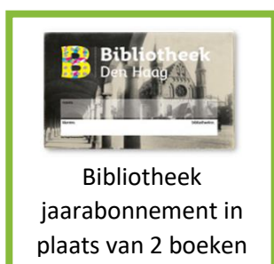
Bibliotheek jaarabonnement in plaats van 2 boeken