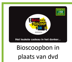
Bioscoopbon in plaats van dvd